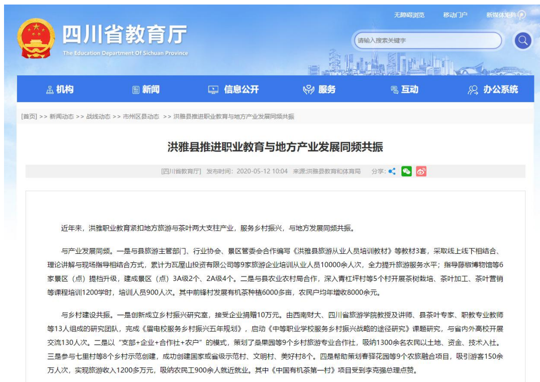
图5 四川省教育厅官网报道学校服务乡村振兴事迹

持，促进了洪雅县乡村振兴工作。前锋村“中国有机茶第一村”建设项目受到李克强总理的高度肯定；中央党校、四川日报、四川省教育厅官网、当代职校生、眉山日报、洪雅融媒体等媒体，多形式多渠道报道学校职业教育助力乡村振兴，在社会上引起了强烈反响，对于推动职业教育更好服务地方经济，起到了助推作用（图5）。