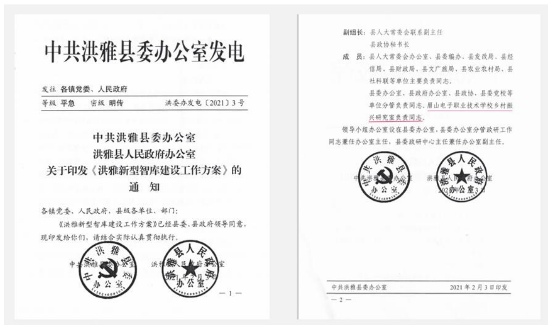
图2 《洪雅县新型智库建设工作方案》

(6) 2021年2月,洪雅县委、政府印发了《洪雅新型智库建设工作方案》,将眉山电子职业技术学校确定为全县乡村振兴研究智库牵头单位,为推动洪雅县乡村振兴提供智力支撑(图2)。