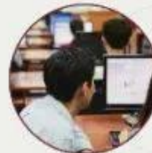
选定为 软件中心大学