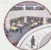
具备尖端ICT技术的 中央图书馆