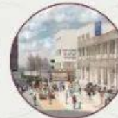
选定为内建首尔校区 社区的事业单位